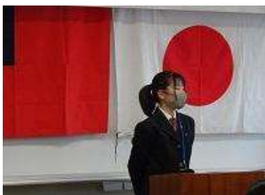
本校生徒会長あいさつ

「羅東高級工業職業学校のみなさん、ようこそおいでくださいました。貴校と本校の姉妹校交流は歴史があり、両校にとって大変貴重なものです。私は、4年前、本校の副校長として、みなさんの先輩にあたる方々をお迎えし、楽しく交流活動を行いました。あれから4年。コロナ禍を乗り越え、こうして皆さんとお会いすることができ、大変感謝しています。限られた時間ではありますが、両校の生徒同士と一緒にさまざまな活動を共にし、交流を深めることを期待しています。」