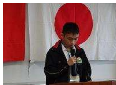
羅東高級職業学校生徒代表あいさつ