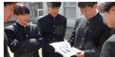
2級土木施工管理技術検定試験

2年生の合格率94%、2級造園施工管理技術検定試験3年生合格率82%の成果です。