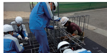
鉄筋加工技術講習会