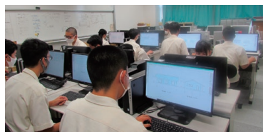
コンピューター実習

CAD製図やグラフィックソフトを用いて画像処理を学習します。3次元CADで3Dプリンタも使用します。