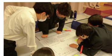
ふじのくにジュニア防災士養成講座

2級土木施工管理技術検定試験(学科)、2級造園施工管理技術検定試験(学科)、測量士補、ふじのくにジュニア防災士、建設経理事務士(3級、4級)