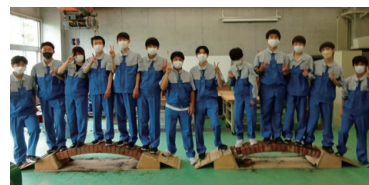
工業技術基礎実習